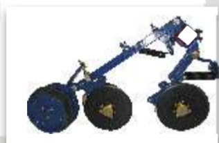
1 - SEMENTE: Disco duplo desencontrado 13" ADUBO: Disco duplo desencontrado 13"