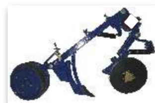
4 - SEMENTE: Sulcador de haste-facão. ADUBO: Disco duplo desencontrado 13"