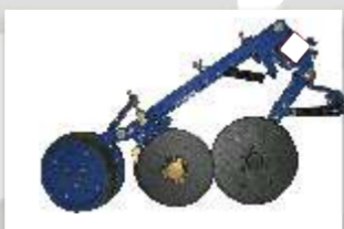
2 - SEMENTE: Disco duplo desencontrado 13" ADUBO: Disco de corte 13" ou 15"