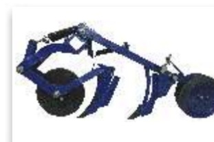
6 - SEMENTE: Sulcador haste-facão ADUBO: Disco de corte 17" e sulcador de haste-facão