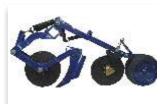
5 - SEMENTE: Disco duplo desencontrado 13" ADUBO: Disco de corte 17" e sulcador de haste-facão