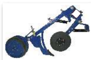
3 - SEMENTE: Sulcador de haste-facão. ADUBO: Disco de corte 13"